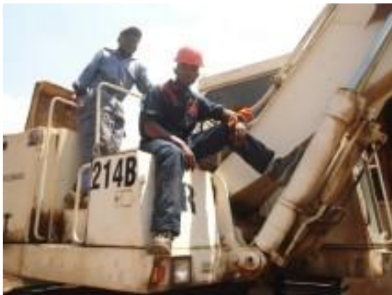
Een oud-student Grevys Mambo

werken hard. Sœur Thérèse bedankt het fonds en de donateurs voor de ondersteuning van deze jonge Afrikanen.